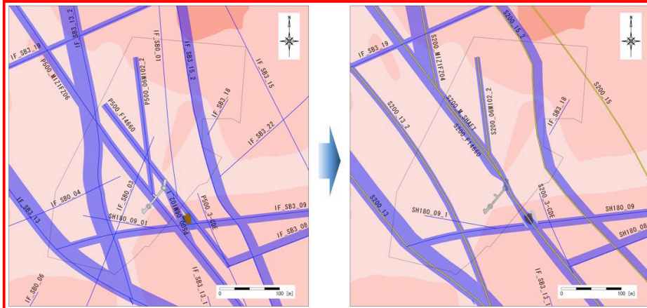
Pilot500地質構造モデルの深度200m水平断面図